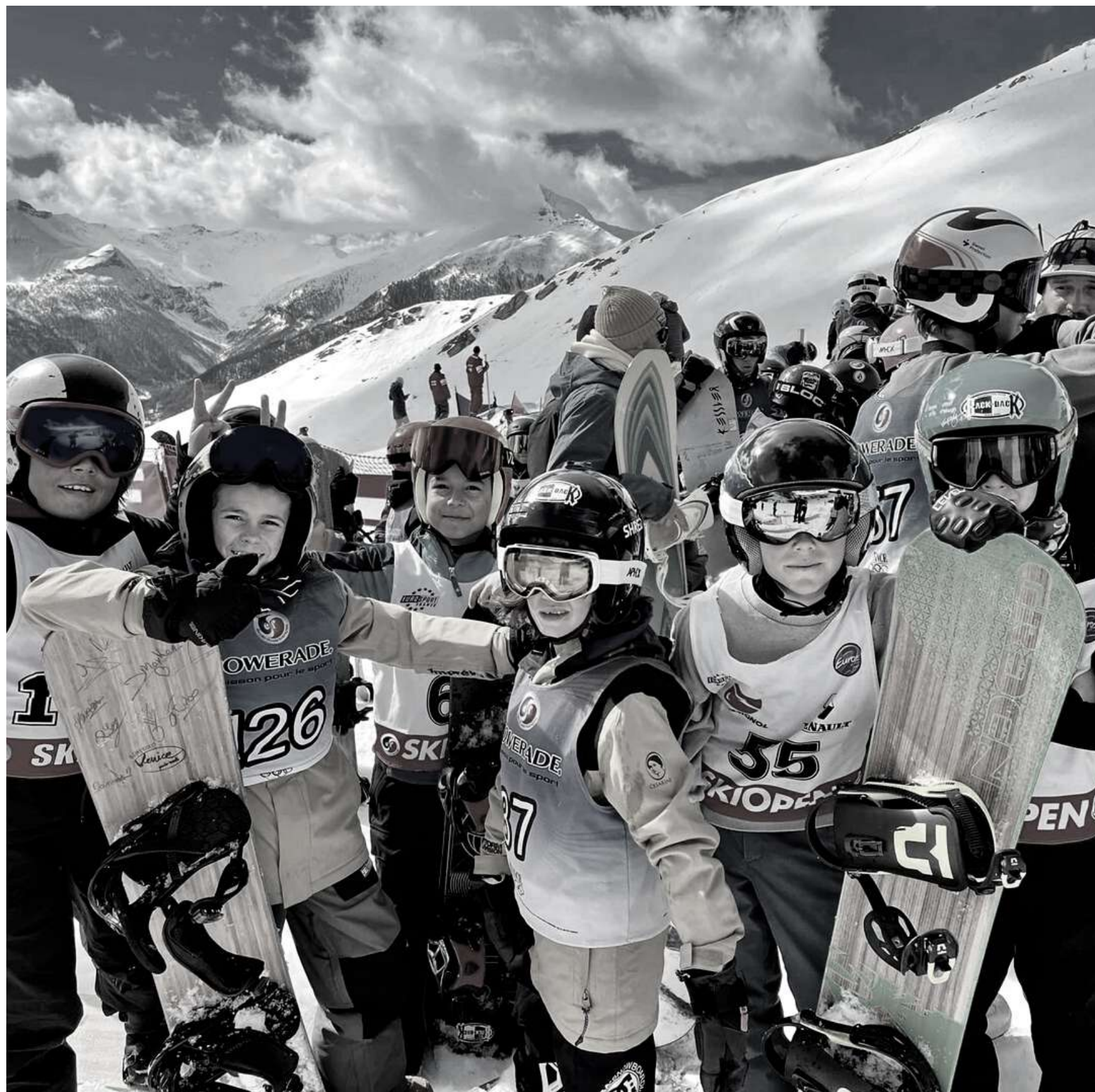
Back to Back Saison 2024